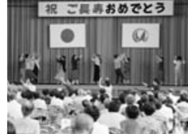
▲昨年の敬老会三原会場

敬老会で金婚夫婦の表彰を行います。昭和37年中に婚姻届を提出した市内在住の夫婦は、お申し込みください。今年度から、昭和36年以前に婚姻届を提出され、市の表彰を受けられていない夫婦も受け付けます。 ▽申込方法 市の窓口備付の申込用紙に戸籍謄本(コピー可)を添えて提出してください ▽申込締切 8月22日(月) 長寿福祉課 ☎44・3005