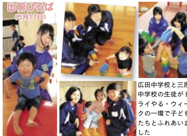
出前ひろば(5月17日) 広田中学校と三原中学校の生徒がトライやる・ウィークの一環で子どもたちとふれあいました