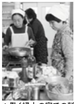
▲働く婦人の家での料理教室