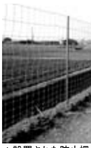
▲設置された防止柵

材を通じて色々な方に出会い、学ばされることが数多くありました。現場で皆さまの話を聞き、記事にする。特集企画もさせていただきました。