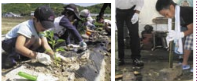
▲なす、ピーマン、トマトなどの野菜苗を植えました ▲地域の人たちに指導していただいた竹炭教室

平成23年9月15日までの申出分(敬称略) ※この欄への掲載を希望する人は、届け出のときに窓口へお申し出ください