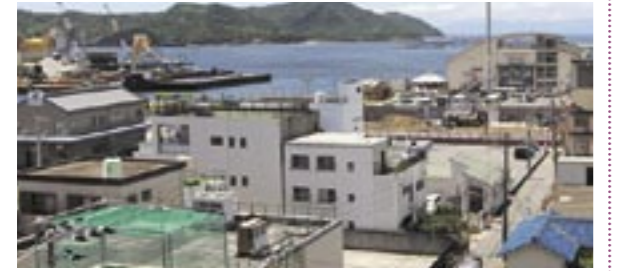
▲なないろ館周辺。9月10日にセレモニーが開催され、愛称発表が行われました

福良の観光拠点であるなないろ館周辺の愛称が「○○○○の郷」に決定しました。さて、この○に入るひらがなは何でしょうか？(ヒントは広報2頁目)