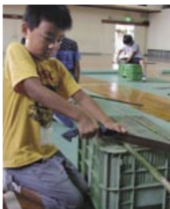
▲お局塚では歴史を学びました ▲竹鉄砲を製作しました