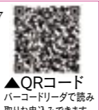
▲QRコード バーコードリーダーで読み取りお申込みできます