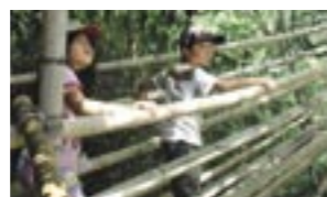
▲里山基地で大自然を満喫