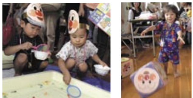
▲浴衣を身にまといおもちゃの金魚すくいに夢中になっています ▲夏まつりでサイコロゲームで遊びます