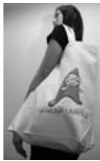
▲お出かけエコバッグ

子育て応援シンボルキャラクター「ゆめるん」のグッズとして、①着ぐるみ②エコバッグを製作しました。