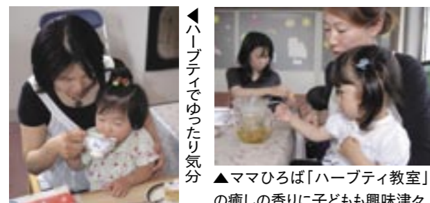
▲ハーブティでゆったり気分