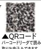
▲QRコード バーコードリーダーで読み取りお申込みできます