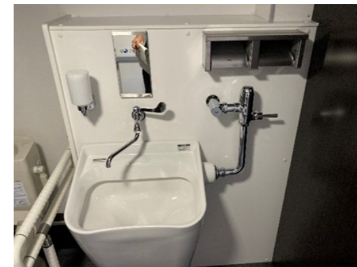
オストメイト対応便器