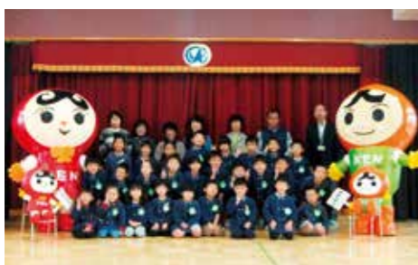
人権教室に参加した阿万保育所の園児ら

法務省では、花の種子などを協力して育てることで、子どもたちに生命の尊さを学んでもらおうと「人権の花」運動を実施しています。今年も広田保育園、志知幼稚園、榎列保育所、阿万保育所の4施設が同運動に取り組みました。 また、神戸地方法務局洲本支局の職員と市内の人権擁護委員らによる人権教室が10月28日に志知幼稚園、11月1日に阿万保育所でありました。同運動を行う施設などを対象に行われた同教室には3～5歳の園児ら