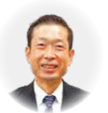
南あわじ市長 守本 憲弘