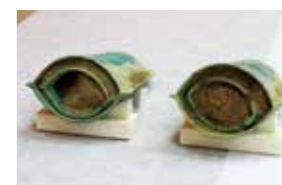
入れ子の3・4号(左)と6・7号(右)