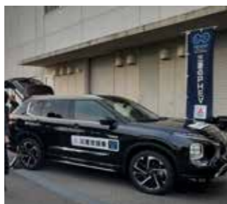
貸与される電気自動車

市と兵庫三菱自動車販売株式会社および三菱自動車工業株式会社は11月7日、災害時における電動車両等の支援に関する協定を締結しました。災害時に両社から貸与される電気自動車などを、被災地における電源供給などに活用します。