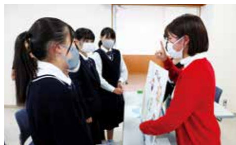
パネルに絵を貼りながら物語などを展開する「パネルシアター」を紹介する短大生（右）