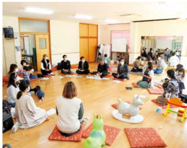
ひろばで話し合う参加者ら

11月4日に西淡志知公民館で行われたひろばでは、親子ら13組が交流。守本市長が加わった座談会もあり、子育て世代が意見を交わしました。