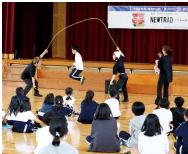
ニュートラッドのメンバーと一緒にパフォーマンスに挑戦する児童（阿万小）