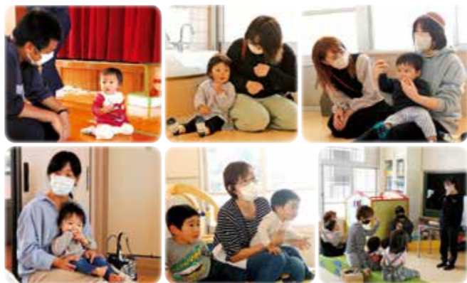
11月12日(土) Sonoda あそびとおはなし広場