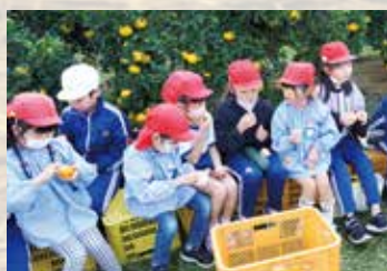
ミカンを味わう子どもたち

倭文保育園の5歳児7人と倭文小学校の3年生10人が11月11日、学校近くの農園でミカン狩りを行いました。食育や環境体験学習の一環として参加した子どもたちは、はさみを使って丁寧にミカンを収穫。取れたての味を楽しみました。