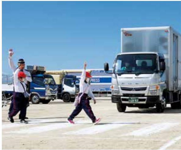
模擬道路の横断歩道を手を上げて渡る児童ら