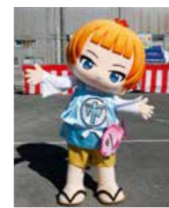
イベント会場に登場したタマイチくん

市地区地域づくり協議会・自治会が主催する「ふれあいタマイチくんまつり」が11月6日、旧三原庁舎跡地で開かれ、市地区のイメージキャラクター「タマイチくん」の着ぐるみが住民らに初めて披露されました。 タマイチくんは、昨年度に募集のあった47作品の中から選ばれたキャラクター。髪型はタマネギ、服装は福の神の戒さまがモチーフになっています。