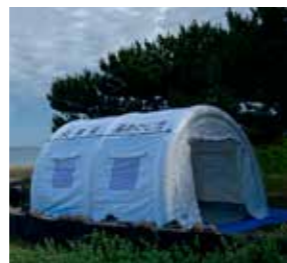
提供されるものと同型のエアテント

市と太陽工業株式会社は10月17日、災害時における天幕等資機材の供給に関する協定を締結しました。災害時には、救護所などの設営に活用できるエアテントなどが同社から提供されます。