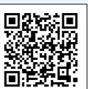
厚生労働省 ホームページ 二次元コード