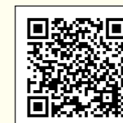
市ホームページ 二次元コード