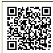
市ホームページ 二次元コード