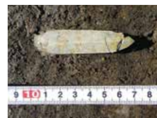
(写真) 剣形滑石製品