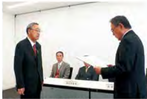
当選証書を受ける永田議員(左)