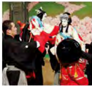
カリキュラムの題材となる淡路人形浄瑠璃

平成31年度から市内の小中学校で、淡路人形浄瑠璃を題材とした南あわじ市コアカリキュラムが実施されます。