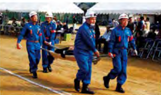
市民の生命・財産を守るため、日々活動する消防団員