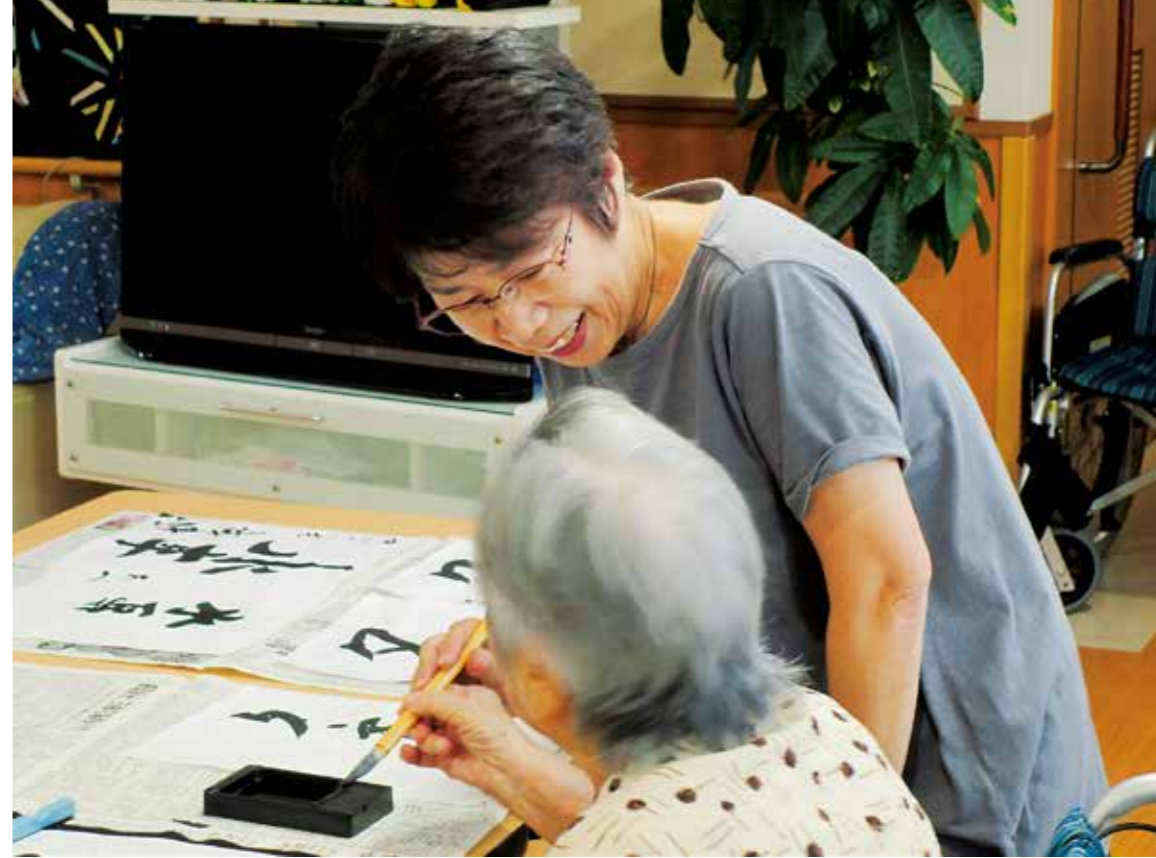
「おもいやりポイント制度」では、シニア世代が人手不足で悩む施設で活動