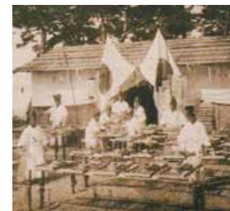
大正時代に白衣白袴の調理人が献上鯛(干物)を作る様子

大正から天皇陛下への献上を続けている丸山の鯛を中心に、南あわじ市の鯛の魅力を知っていただくためのイベントを開催します。 日時 10月12日(土) 午前9時30分~正午ごろ 内容 大正時代の献上鯛(干物)作成作業の復刻、南あわじ市で捕れた鯛料理の振る舞いなど 場所 魚彩館周辺 ※詳しくは市ホームページをご覧ください