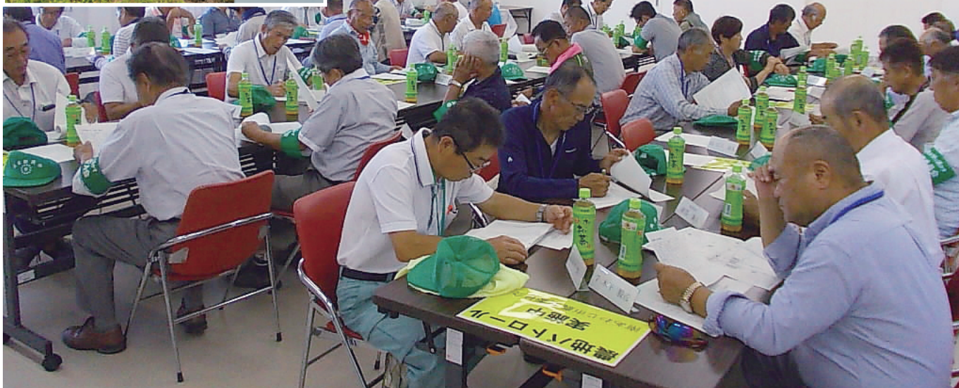
8月29日 農地パトロール出発式の様子。各班に分かれて荒廃農地・無断転用の調査を実施しました。