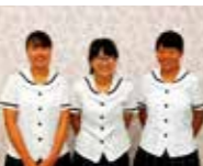
番組制作に協力してくれた淡路三原高校郷土部員