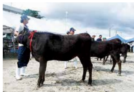
畜産共進会での審査の様子

第14回南あわじ市「食」まつり・畜産共進会を9月22日、23日の2日間、賀集スポーツセンターグラウンドで開催。市内各地から黒毛和種102頭、ホルスタイン種32頭が出品され、月齢別に資質と美を競いました。