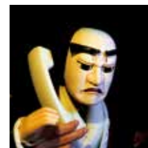
渦巻子を巧みにだます詐欺師役「鬼瓦」