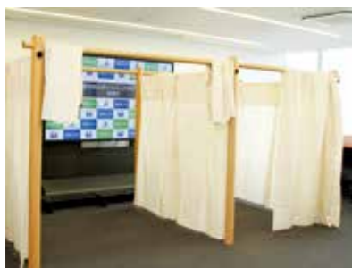
簡単に組み立てることができる間仕切りシステム

同社は、香川県の倉庫に100セットを保管し、災害発生時に避難所へ運搬することにします。