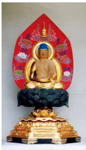
文化財に指定された栄福寺所有の木造釈迦如来坐像

▽日時 11月24日(土) 午後1時〜(約2時間) ▽場所 栄福寺 ▽定員 50人(先着順) ▽参加費 500円 ▽申込方法 社会教育課に電話でお申込みください。 ▽社会教育課 ☎43・5232