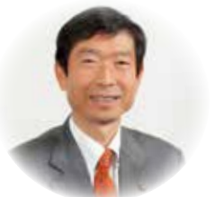
南あわじ市長 守本 憲弘