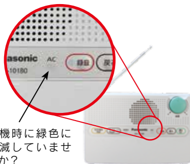
待機時に緑色に点滅していませんか?

防災行政無線戸別受信機は電波の受信状況が良ければ待機時のACランプが緑色で「点灯」しています。しかし、天候や周囲の家電等の影響により、受信状況が悪くなると待機時でも緑色で「点滅」します。待機時にACランプが緑色で点滅する事象が頻繁に発生する場合は、設置場所を変更し受信状況を改善する必要がありますので、危機管理課までご連絡ください。またACランプが点灯して