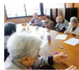
集いの場で楽しい時間を過ごす参加者

高齢者の生きがいづくりを支援し、介護予防を図る「集いの場」をご紹介します。松帆・湊地区にお住まいの10人の方は、一緒に利用していたミニデイサービスが終了するときに、「今後も皆で集まりたい」と話し合い、4月から集いの場「ちどり会」を始めました。1回目は手芸とお茶会で楽しい時間を過ごし、次回の計画も話し合っています。