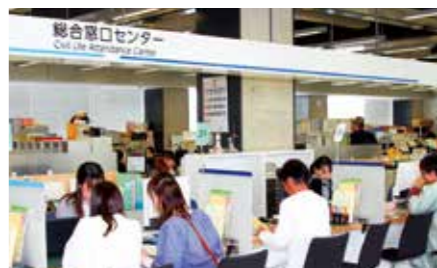
総合窓口センターの開設により、市民の利便性の向上を図ります

南あわじ市役所では、4月2日から本館1階に各種届出や証明書の発行業務等を行う総合窓口センターを開設しました。 なお、休日窓口は日曜日(年末年始を除く)のみとなりますが、毎週木曜日(祝日・年末年始を除く)は午後7時まで窓口業務を行いますので、ご利用ください。