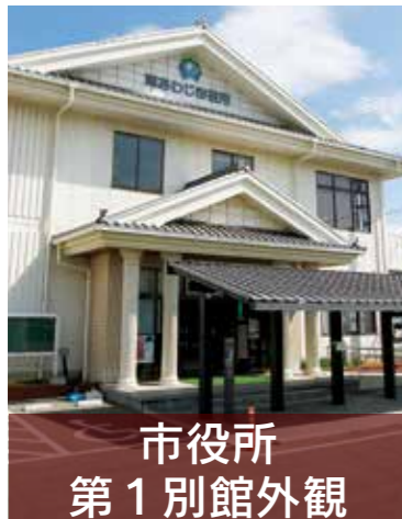
市役所 第1別館外観