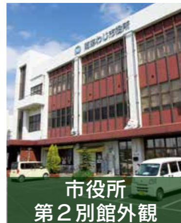
市役所 第2別館外観