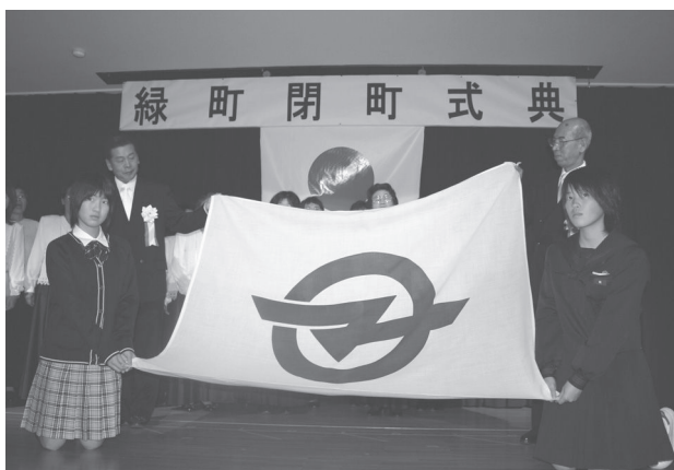
緑町閉町式 (平成16年12月18日)