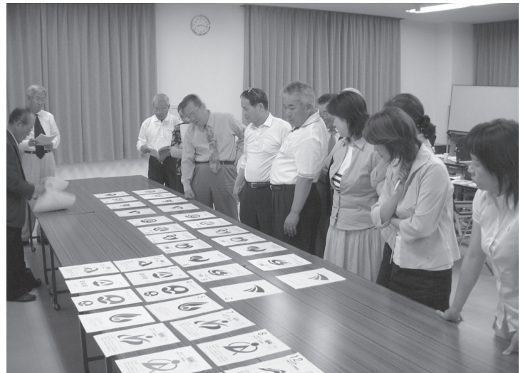
第2回市章小委員会 (平成16年6月9日)