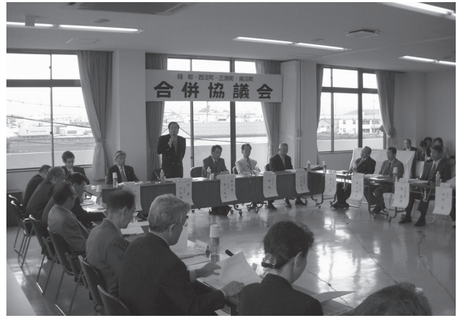
第1回緑町・西淡町・三原町・南淡町合併協議会 (平成14年4月24日)