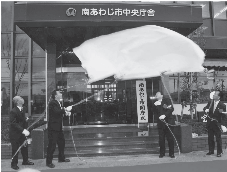
『南あわじ市』開庁式 (平成17年1月11日)