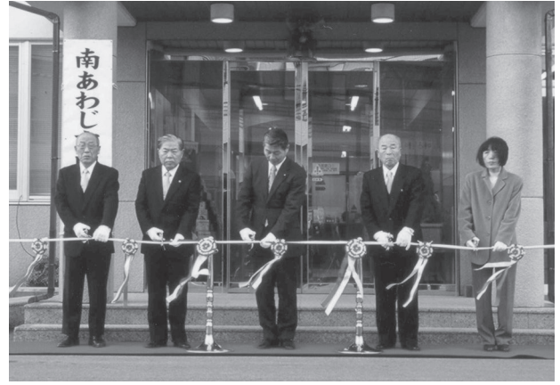
『南あわじ市西淡庁舎』開庁式 (平成17年1月11日)