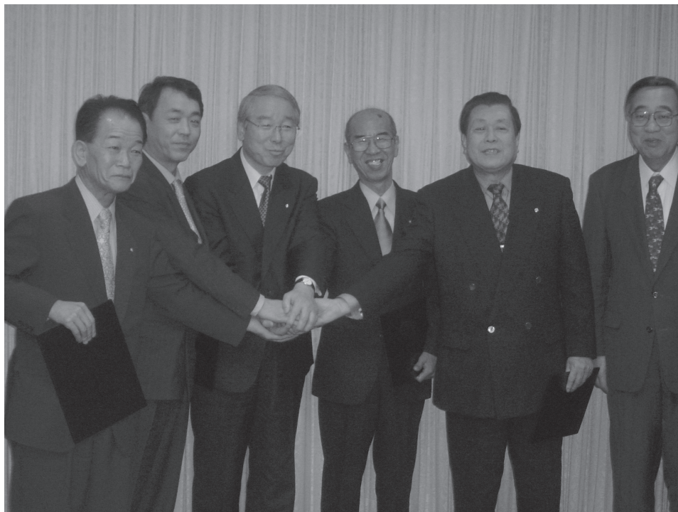
兵庫県知事より廃置分合処分決定書の交付 (平成16年3月25日)