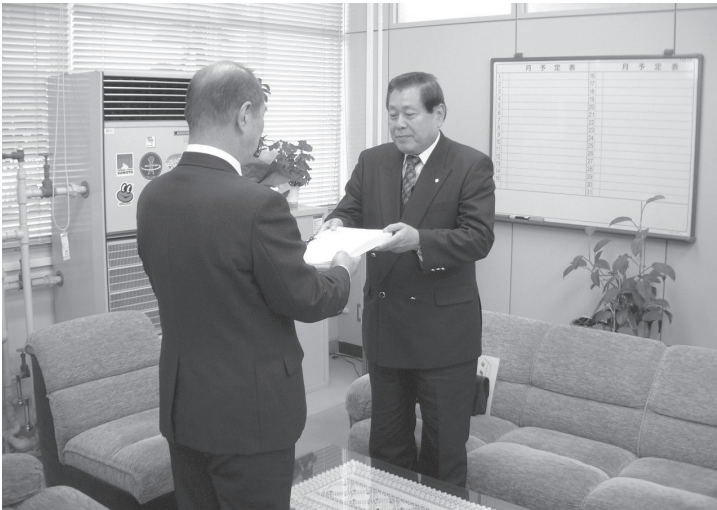
廃置分合申請書を淡路県民局長に提出 (平成15年12月18日)