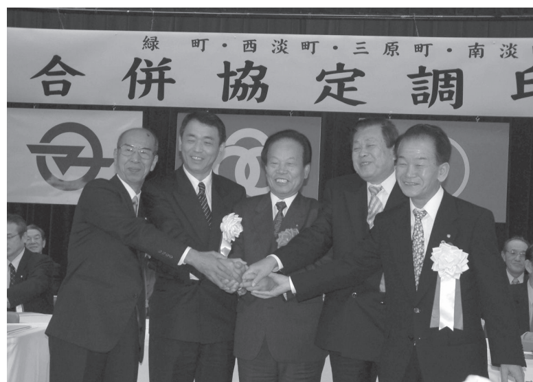
緑町・西淡町・三原町・南淡町合併協定調印式 (平成15年12月6日)