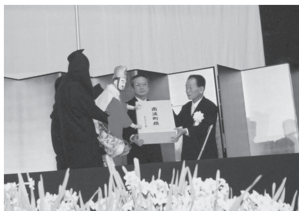
南淡町閉町式 (平成16年12月12日)