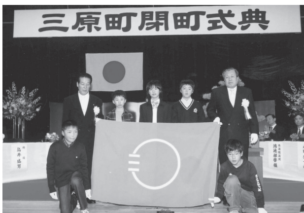
三原町閉町式 (平成16年12月18日)