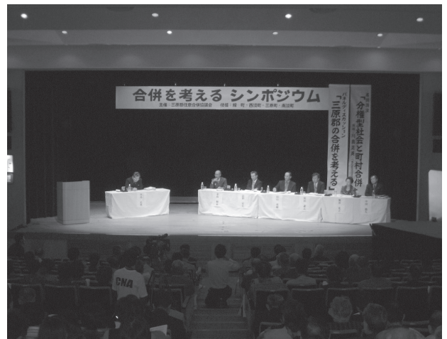
三原郡の合併を考えるシンポジウム (平成13年10月27日)