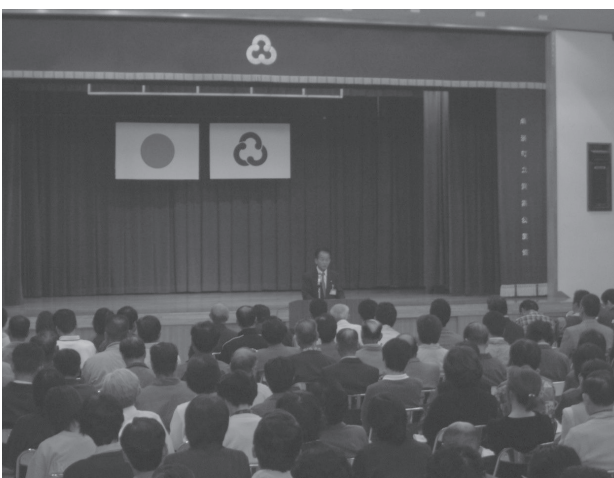
平成13年度住民説明会 (平成13年10月29日～翌年 2月5日)