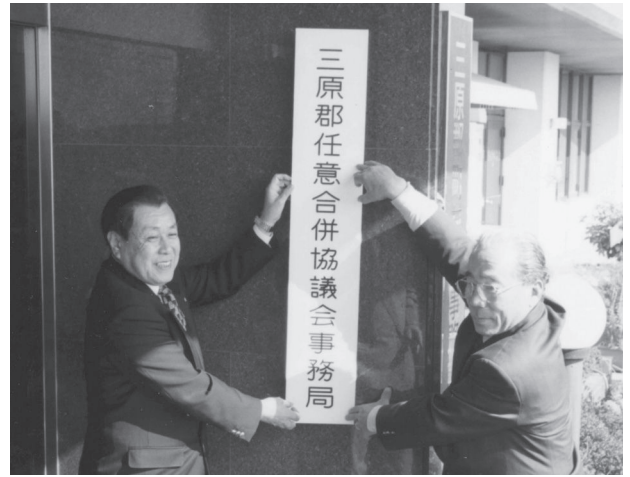
三原郡任意合併協議会設置 (平成13年 4月1日)