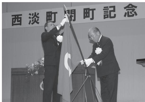
西淡町閉町式 (平成16年12月18日)