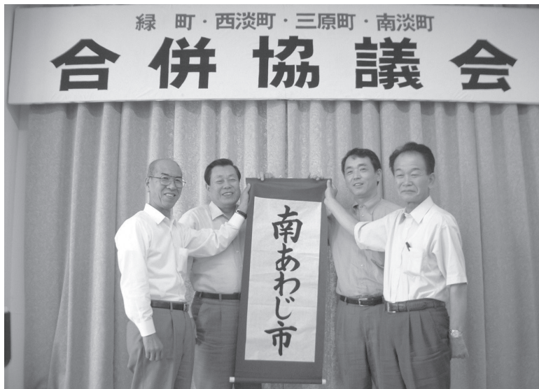
新市名『南あわじ市』決定 (平成15年6月25日)