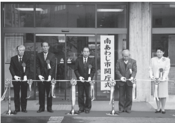
『南あわじ市三原庁舎』開庁式 (平成17年1月11日)