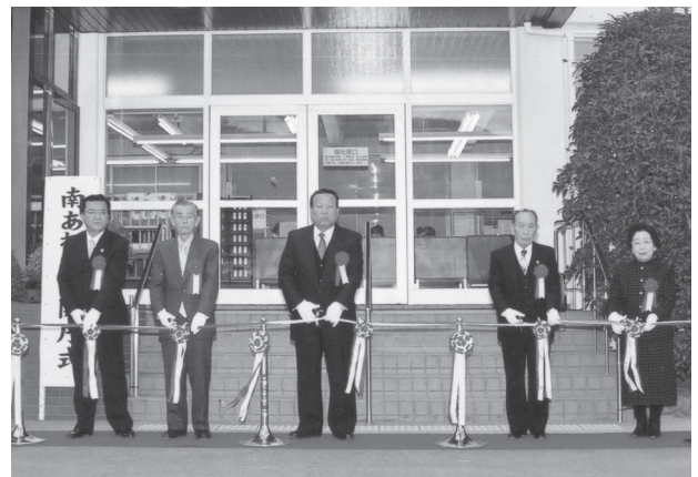
『南あわじ市南淡庁舎』開庁式 (平成17年1月11日)