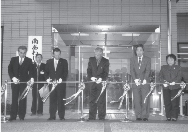
『南あわじ市緑庁舎』開庁式 (平成17年1月11日)