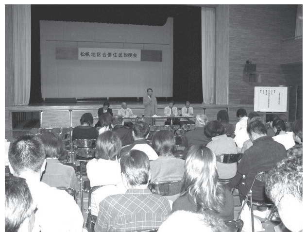
平成15年度合併協議最終住民説明会 (平成15年10月18日～11月14日)