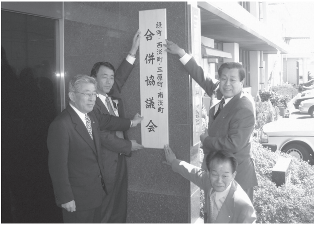
緑町・西淡町・三原町・南淡町合併協議会設置 (平成14年4月1日)