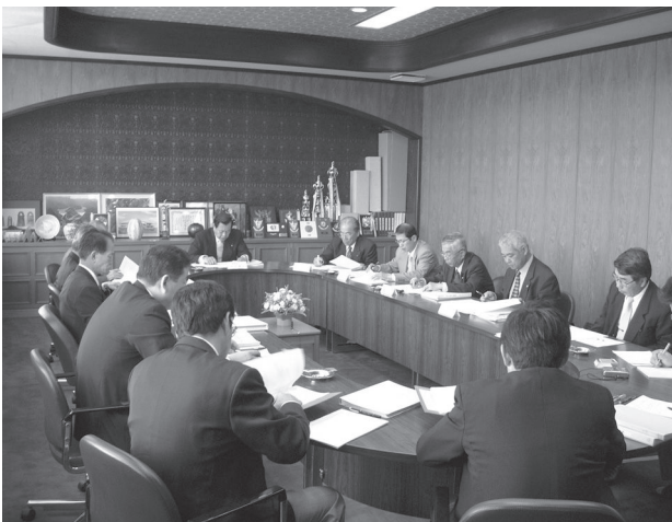
第1回三原郡任意合併協議会 (平成13年 4月2日)