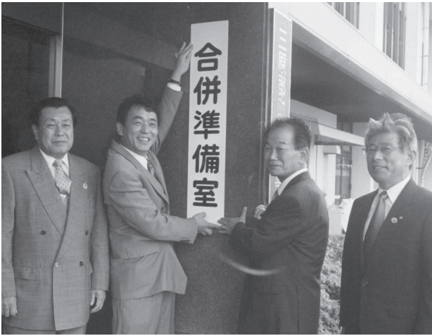
三原郡合併準備室設置 (平成12年 6月27日)