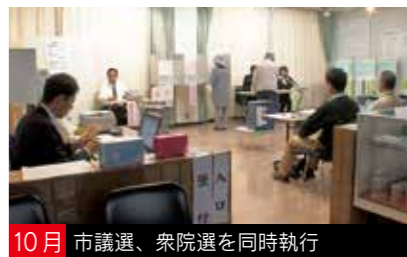
10月 市議選、衆院選を同時執行