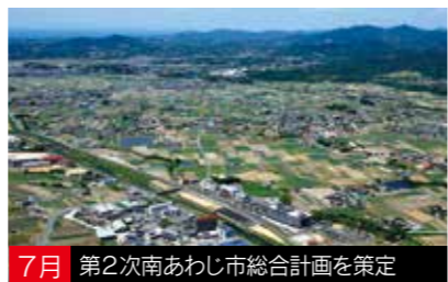
7月 第2次南あわじ市総合計画を策定