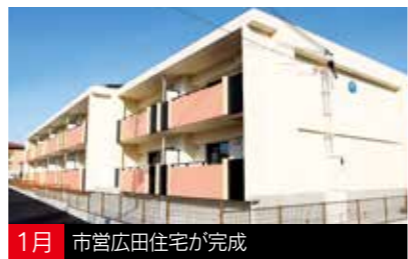
1月 市宮広田住宅が完成