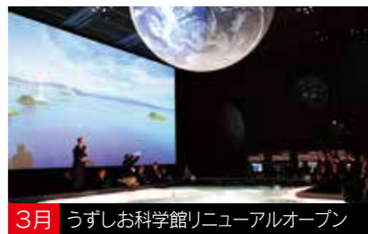
3月 うずしお科学館リニューアルオープン

また、議会傍聴者の増加、インターネット配信、広報紙や子ども議会、議会報告会、各種団体との意見交換会などにより、市民と議会がより身近な関係になるよう、開かれた議会をめざしていきます。 今年も、より一層のご指導ご鞭撻を賜りますようお願い申し上げますとともに、市民の皆様方のご健勝、ご多幸をお祈り申し上げます。新年のご挨拶とさせていただきます。