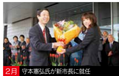
2月 守本憲弘氏が新市長に就任