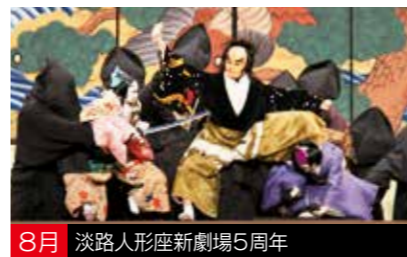
8月 淡路人形座新劇場5周年