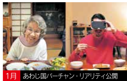
1月 あわじ国バーチャン・リアリティ公開