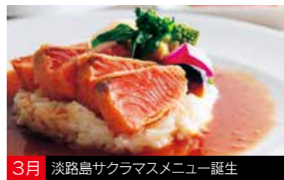
3月 淡路島サクラマスメニュー誕生