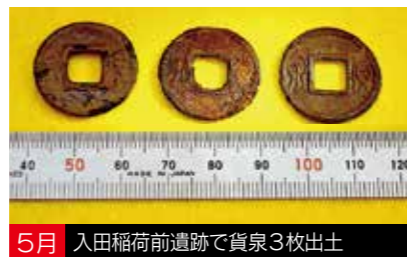
5月 入田稲荷前遺跡で貨泉3枚出土