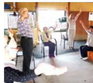
みんなで運動する集いの場「笑来」のメンバー