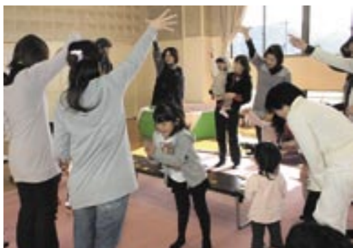
はさみを使って折り紙で遊ぼう (働く婦人の家)