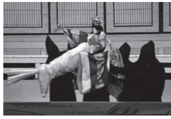
▲玉藻前囃袂 神泉苑の段

▽日時 3月6日(土) 午後7時〜※入場無料 ▽場所 三原公民館大ホール ▽演目 「玉藻前囃袂 神泉苑の段」「賤ヶ嶽七本槍 勝久出陣の段」 淡路人形座 ☎52・0260