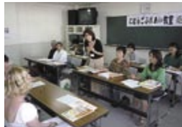
▲学び合うことが支援