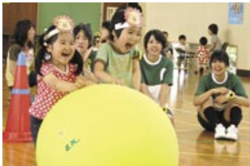
▼子育て運動会(働く婦人の家)

☞お申し込み先=⑦各センター、⑥みどり、⑤せいだん、①・④みはら、②・③なんだん