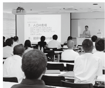
▲オープンキャンパスの様子