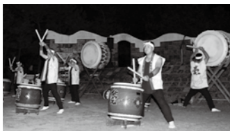
▲花火とコラボレーションした南あわじ太鼓衆「麓」(慶野)