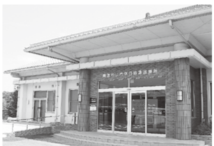
▲旧南淡福祉保健センターへ移転した南あわじ市休日応急診療所

「市の救急医療の拠点として、住民の健康と生命の確保のため適切に運営していきたい」と話しました。