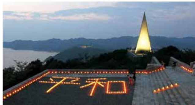
▲若人の広場公園で1200個の灯籠が灯された萬灯会(まんどうえ)