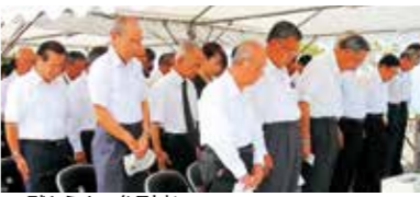
▲黙とうする参加者

終戦の日の8月15日、若人の広場公園で、市主催の戦没学徒追悼献花式を行いました。中田市長をはじめ、南あわじ市遺族会、市議会議員ら約60人が参列。今年も地元南淡中学校の生徒会役員や吹奏楽部員も参列。同部員のトランペットの音色とともに黙とうをささげた後、白菊を献花台に供えて戦没