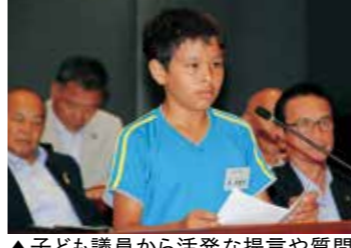
▲子ども議員から活発な提言や質問が出されました

市議会が主催して「第2回子ども議会」が8月6日に市役所議場で開催されました。南あわじ市議会では、次代を担う子どもたちに政治や行政に関心を持って学んでもらい、幅広い世代からまちづくりの意見や考えを聴いて今後の議会活動に生かしていこうと開催しました。市内各小学校代表16人の「子ども議員」からは、通学路の安全や住みやすい町の実現、楽しいイベントの実施など、南あわじ市のまちづくりについて子どもの目線や想いから、活発な提言や質問を行って、市議会議員から答弁を受けました。