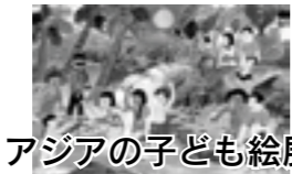
アジアの子ども絵展

きらら・ウィンズ・いちばん星 わたがし、やきそばパン、 ハン草木染め体験 託児所・あそび広場 (事前申込制)