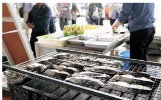
▲サワラの味噌漬けコンテスト

瀬戸内海の旬魚であるサワラをPRしようと4月24日、福良漁業協同組合は同組合前で第1回サワラ祭りを開催しました。サワラは産卵期となる春に瀬戸内海を回遊するため、春を告げる魚といわれています。祭りでは、商品化に向けたレシピコンテストやサワラ丼の振る舞いが行われ、訪れた観光客や住民らは旬のサワラに舌鼓を打っていました。