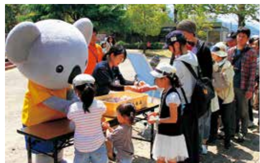
▲来園者に紅白餅が振る舞われました