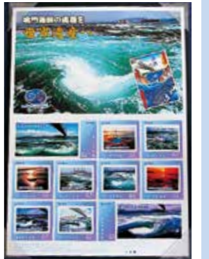
▲発売のフレーム切手

渦潮の世界遺産登録への機運を高めてもらうとオリジナルフレーム切手「鳴門海峡の渦潮」が発売されました。4月19日、発売を記念して渦潮観潮船「日本丸」の船上で日本郵便近畿支社と四国支社から自治体関係者や写真提供者らに切手が贈呈されました。フレーム切手の価格は、1シート税込1230円で、淡路島徳島市、鳴門市等の郵便局で4月20日から1250シートが販売されています。