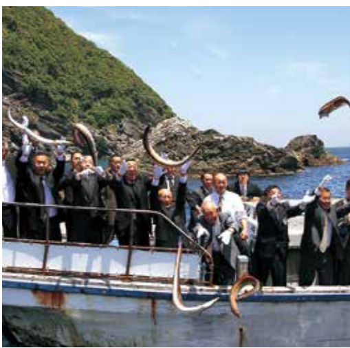
▲上立神岩付近の船上から一斉に鱧を放流する参加者

淡路島の夏の味覚を代表とする鱧の本格的な季節を迎え、豊漁と商いの繁盛を祈願する「鱧供養祭」が5月18日、沼島の西光寺で催されました。水槽に入った鱧を前に供養が行われた後、船に乗り、海上の上立神岩の前で一斉に生きた鱧を放しました。