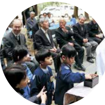
▲伊加利こども園の園児らも参列