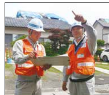
▲現地で被害認定調査を行う2人

り、「阪神淡路大震災の恩返しをしたい」「少しでも早い復旧に向けて貢献したい」と決意を述べ、現地で使命を果たしました。