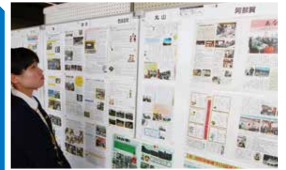
▲1階ロビーに設置した地域づくり掲示板

市内の21地区において、それぞれの地域の様々な情報を地域住民にお知らせする広報紙が発行されています。 その21地区の広報紙を「地域づくり掲示板(地域の情報掲示板)」として、市役所本館の1階ロビーに集めて、自分の住んでいる地域以外の広報紙も、一度にご覧いただけるようにしました。 各地域の広報紙は、市が発行している広報とは異なり、より地域に身近な情報を地域