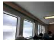
土生港から沼島汽船で沼島港へ