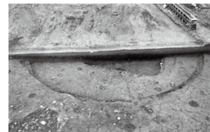
▲島内最大級の円形竪穴住居