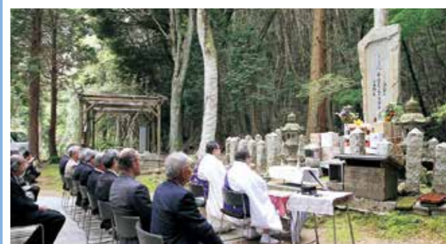
▲局の霊を慰める参列者

ていき、参加者は昔のまちや暮らしの様子を観ながら時代をさかのぼって、古き良き時代の想い出を話し合っていました。