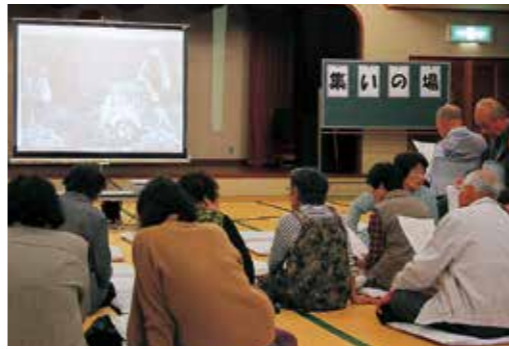
▲昔なつかし写真映写会が開催された「集いの場」