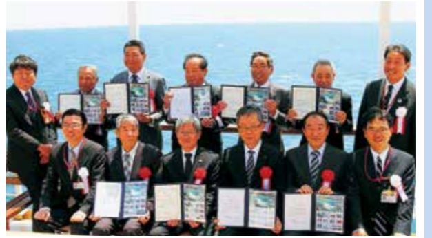
▲渦潮観潮船で行われた贈呈式

渦潮の世界遺産登録への機運を高めてもらうとオリジナルフレーム切手「鳴門海峡の渦潮」が発売されました。4月19日、発売を記念して渦潮観潮船「日本丸」の船上で日本郵便近畿支社と四国支社から自治体関係者や写真提供者らに切手が贈呈されました。フレーム切手の価格は、1シート税込1230円で、淡路島徳島市、鳴門市等の郵便局で4月20日から1250シートが販売されています。