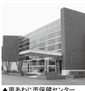
▲南あわじ市保健センター

これにより、4月1日から「緑保健福祉センター」の名称を「南あわじ市保健センター」に変更しました。