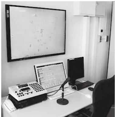
▲デジタル防災行政無線整備事業