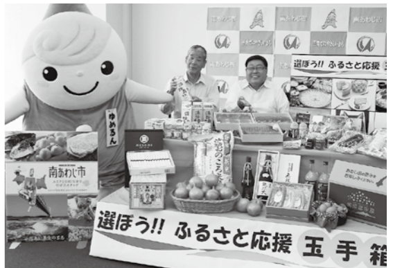
▲ふるさと南あわじ応援寄附金事業