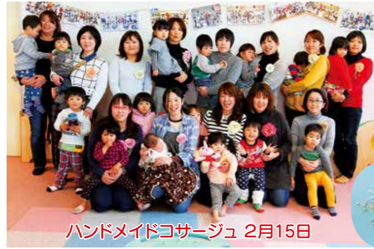
ハンドメイドコサージュ 2月15日