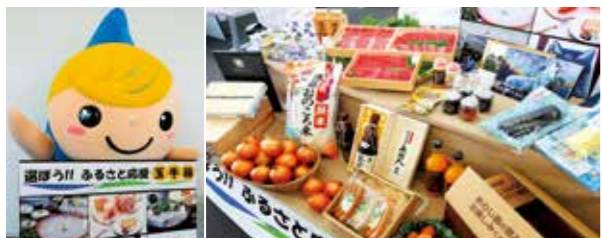
▲南あわじ市の●●品がそろって大好評です!

を募集します。説明会を3月28日(月)に中央公民館で開催します。●に入る漢字2文字をお答えください。(ヒントは広報4頁)