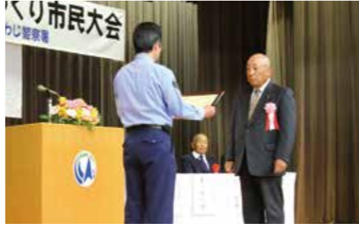
▲受賞者に賞状が手渡されました

安全で安心して暮らせるまちづくりを目指して「暴力追放・安全安心まちづくり市民大会」が10月10日、市役所第2別館多目的ホールで開催され、防犯に功労の者に表彰状が贈られました。受賞者は次のとおりです。(順不同)