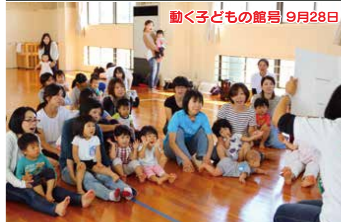
動く子どもの館号 9月28日