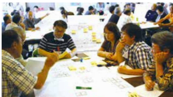
▲避難所運営ゲームに取り組む参加者

県下で最も大きな津波の被害の想定がされている福良地区で9月27日、「福良うずまるフェスタ」「津波防災フォーラム」を開催しました。