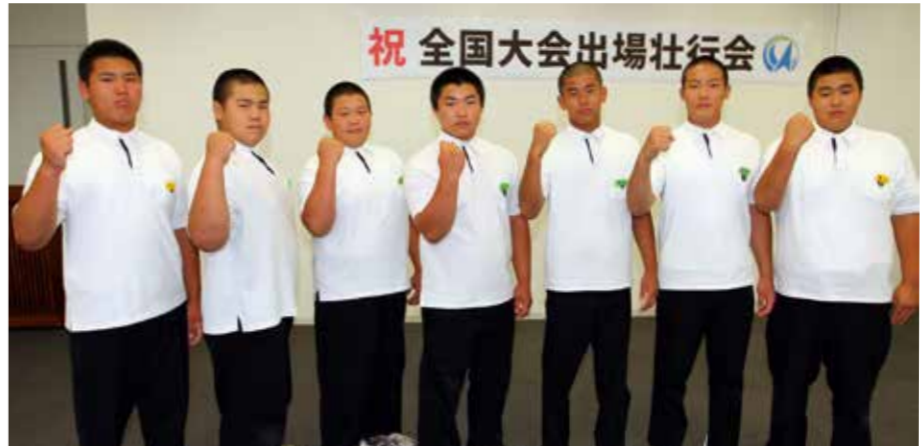
▲全国大会出場の壮行会で健闘を誓う南淡中学校柔道部のメンバー

南淡中学校柔道部が全国大会のマルちゃん杯全日本少年柔道大会(9月22日・東京武道館)に出場し、強豪がひしめく団体戦でベスト16に輝きました。