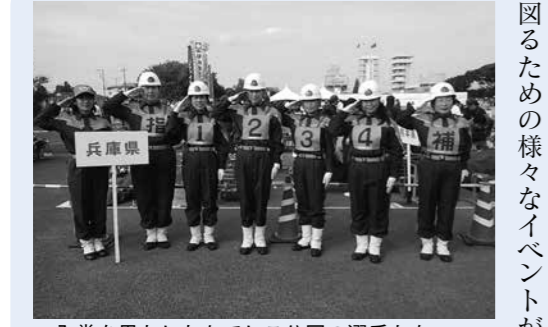
▲入賞を果たしたなでしこ分団の選手たち