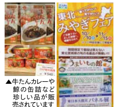
▲牛たんカレーや鯨の缶詰など珍しい品が販売されています

東北みやぎフェアが湊のショッピングセンター・シニアで11月15日まで開催されています。東日本震災から4年半以上経過して、宮城県塩竈市水産振興協議会や同市観光物産協会などが主催して県内の水産加工物や特産品を販売しています。南あわじ市出身の県派遣職員も塩竈市に勤務している繋がりもあって、兵庫県からの支援に感謝をこめて開かれて