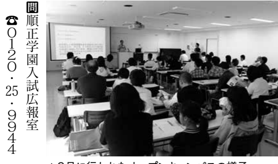
▲9月に行われたオープンキャンパスの様子

「寄附ありがとうございます。」 り、来場者も毎年楽しみにされているようです。両イベントともに、開催にご尽力いただきました実行委員会の方々に厚くお礼申し上げます。 先般、TPP(環太平洋連携協定)の大筋合意が成立したことは、新聞やテレビで報道されているとおりであります。私も兵庫県選出の国会議員の先生方をお願いしているところでありますが、全国市長会では、1.国民生活全般に与える影響について明確な説明を求め、2.総合的な国内対策を速やかに講じること、3.地方における重要な産業である農林水産業が将来にわたり持続的発展を図るよう地域特性に応じた施策を講じることなどを先日本国に対して要求をいたしました。 また、国の最も重要な統計調査であります国勢調査が10月1日を基準日に全国で実施され、市民の皆さんにもお忙しい中ご理解・ご協力をいただき、有難うございました。 市制10周年、市民の皆さんのご理解・ご協力に心より感謝申し上げますとともに、これからますますとお願い申し上げます。