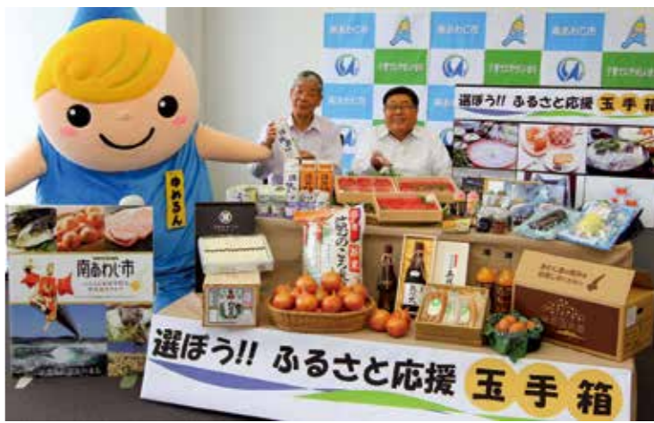
▲1万円以上寄附された個人を対象に、感謝をこめて特産品贈答事業をスタート

び地域活性化を目的に、ご寄附いただいた多くの方々へ特産品を贈答する取り組みです。特産品出品参加事業者は約50社で、淡路島3年とらふぐ、淡路島たまねぎ、淡路ビーフなど、多種多様な特産品(約250品)を揃えています。