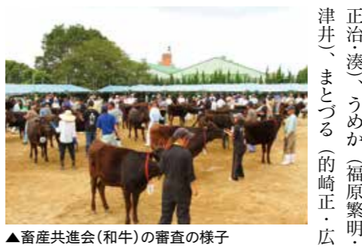
▲畜産共進会(和牛)の審査の様子