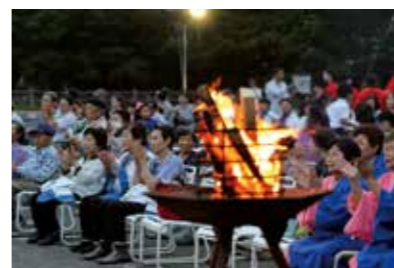
▲慶野松原荘横の駐車場で特設ステージが設けられて大勢の人たちで賑わいました

毎年多くの海水浴客が訪れ、白砂青松の夕陽が美しい慶野松原で9月26日、かがり火コンサートが開催されました。慶野松原活性化協議会が主催して入場無料で行われ、観光客や地域の人たちに喜んでもらえるイベントで慶野松原のにぎわいを継続させようと開かれました。かがり火が灯り、海からの風がそよぐ会場で、参加者たちは演奏や歌、踊りの迫力あるス