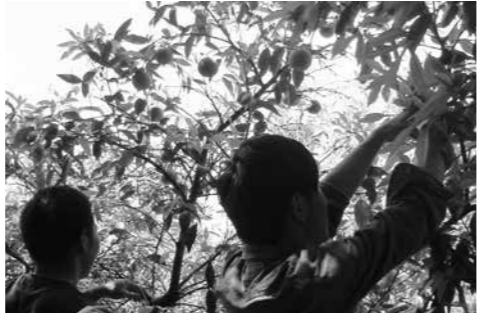
▲ナルトオレンジを収穫する学生

◆オープンキャンパス 地域創成農学部オープンキャンパスを次の日程で開催します。参加申込み不要で学食が無料体験できる「オープンキャンパス」です。受験生だけでなく、保護者の方、ご家族方の参加も大歓迎です。駐車場も多数ございます。この機会に大学を見学してみませんか? ▽内容 学食無料体験、学科説明、授業体験、入試相談、AO面談ほか ▽日時 11月15日(日) 午前11時～午後4時 ▽場所 同大学南あわじ志知キャンパス