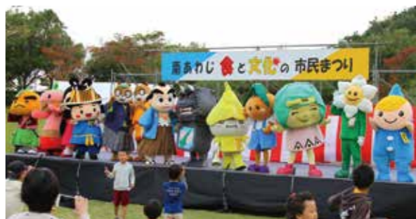
▲島内外から集まったゆるキャラによる瓦割り大会が行われました

淡路ふれあい公園で10月11日、南あわじ食と文化の市民まつりが開催され、多くの人で賑わいました。自治会や各種団体でつくる実行委員会が主催して、吹奏楽や和太鼓、伝統芸能のステージや特産品のPRを行う「食の市」が開かれました。