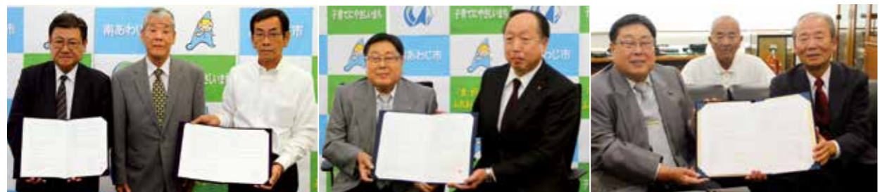
▲淡路紙工株式会社・株式会社サンコー(左)、兵庫県LPガス協会淡路支部(右)と応援協定を締結 ▲NPO法人コメリ災害対策センターと応援協定を締結 ▲兵庫県タクシー協会淡路島支部と応援協定を締結

淡路紙工株式会社、株式会社サンコーと締結。市の要請に応じて避難所などに設ける段ボール製の簡易ベッドやシート、間仕切りなどの救援物資を供給するものです。