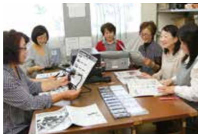
▲カセットテープに録音、編集、ダビングして利用者に毎月郵送しています

同グループは、昭和57年4月に結成されて同年7月から旧三原町の広報紙の録音を開始。33年間の地道な活動を続けてこられました。現在は、主婦や自営業の女性13人が毎月当番制で広報紙の朗読活動を行っています。事前に自宅で原稿を下読みして、人名や地名を読みまちがえないよう慎重に、また、行政用語も分かりやすい言葉に置