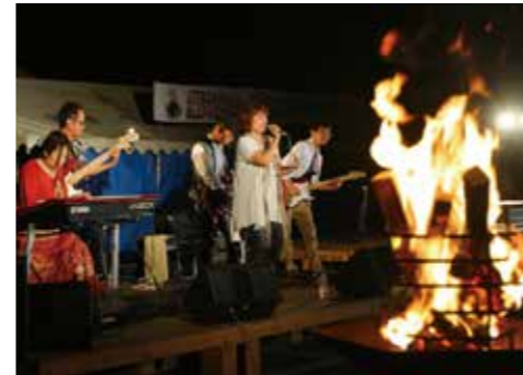
▲かがり火が灯る会場で開かれたコンサート

毎年多くの海水浴客が訪れ、白砂青松の夕陽が美しい慶野松原で9月26日、かがり火コンサートが開催されました。慶野松原活性化協議会が主催して入場無料で行われ、観光客や地域の人たちに喜んでもらえるイベントで慶野松原のにぎわいを継続させようと開かれました。かがり火が灯り、海からの風がそよぐ会場で、参加者たちは演奏や歌、踊りの迫力あるス