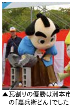
▲瓦割りの優勝は洲本市の「嘉兵衛どん」でした

淡路ふれあい公園で10月11日、南あわじ食と文化の市民まつりが開催され、多くの人で賑わいました。自治会や各種団体でつくる実行委員会が主催して、吹奏楽や和太鼓、伝統芸能のステージや特産品のPRを行う「食の市」が開かれました。