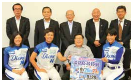
▲表敬に訪れた兵庫ディオーネの選手ら

今年のステージでは、島内外から13体のゆるキャラが集まって、そのうち5体が瓦割りに挑戦。1位に輝くキャラを予想して、当たった人が景品をもらえる「ゆるキャラガチンコ瓦割り大会」が行われ、会場を沸かせました。また食の市では地元食材を使った加工食品や瓦グッズの販売ブース約30店が軒を連ね、淡路手延素麺の無料振舞いや淡路ビーフの格安振舞いなどに長蛇の列ができる大盛況でした。