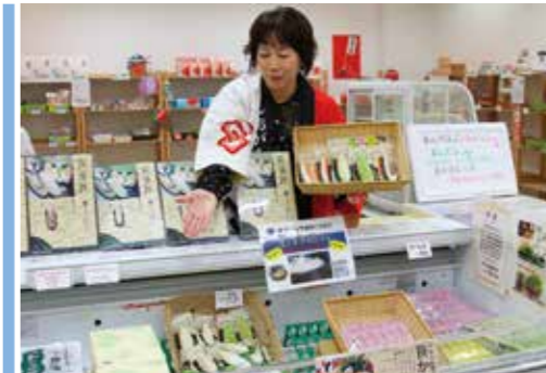
▲「うまいもの館」の特設ブース

東北みやぎフェアが湊のショッピングセンター・シニアで11月15日まで開催されています。東日本震災から4年半以上経過して、宮城県塩竈市水産振興協議会や同市観光物産協会などが主催して県内の水産加工物や特産品を販売しています。南あわじ市出身の県派遣職員も塩竈市に勤務している繋がりもあって、兵庫県からの支援に感謝をこめて開かれて