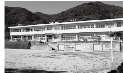
▲元灘 小学校 ◆ふるさと創生課Eメールアドレス furusato@city.minamiawaji.hyogo.jp

市では、閉校となった小学校の校舎等の跡地施設の建物と、土地及びその他付属施設（以下「跡地施設」という。）を有効に活用するために、 地域の振興を目的とした事業を展開する事業者等 （以下「事業者」という。）を幅広く募集しています。 募集施設 （小学校2施設） ①元灘小学校 所在地 兵庫県南あわじ市灘山本313番地 施設概要 土地6333㎡、35㎡ 建物（管理教室棟1346㎡、特別教室棟156㎡、その他96㎡） ②旧丸山小学校 所在地 兵庫県南あわじ市阿那賀1443番地1 施設概要 土地4974㎡ 契約内容 跡地施設にかかる市長と事業者との契約は、無償使用貸借契約となります。