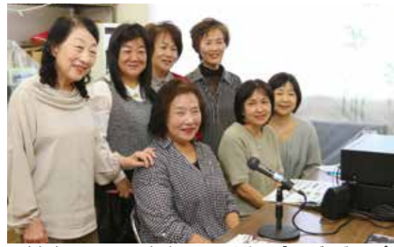
▲広報南あわじ10月号朗読で400号を迎えた「ひこばえグループ」

同グループでは「声の広報を知らない人や、まだ利用されていない家庭にも届けることができれば」と利用者を募っています。声の広報の郵送を希望される人は社会福祉協議会 ☎44・3007までお問い合わせください。