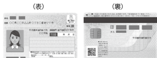
▲個人番号カードのイメージ