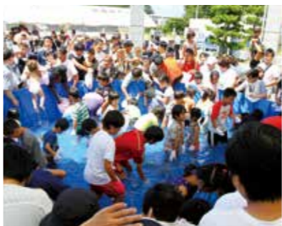
▲魚のつかみ取りに挑む子どもたち

多くの大漁旗がたなびくイベント会場では、旬の魚の特売会としてガシラやアジのつめ放題