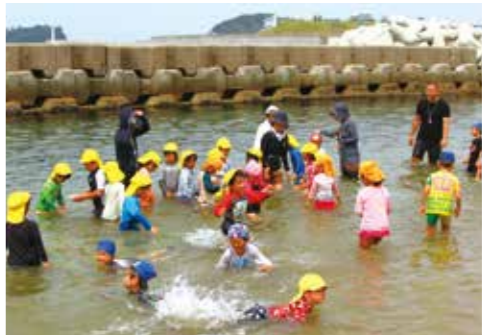
▲丸山幼稚園の目の前のビーチで海あそびを楽しむ園児たち(8月6日)

丸山幼稚園の目の前は海が広がり、美しい光景と自然がいっぱいで、夏は海遊びが満喫できます。丸山・阿那賀 伊加利幼稚園では、市内の幼稚園や保育所の園児にも体験して楽しんでもらおうと合同の海あそび交流を行っています。海で泳いだり砂浜で遊んだり、クラゲやウニなどの海の生き物に触れたりして、園児たちは思い思いに海での遊びを楽しんでいました。