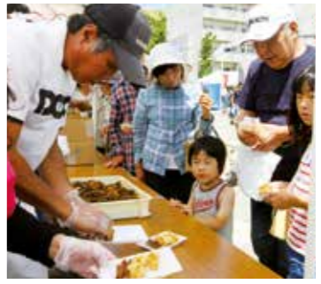
▲ハモの天ぷらと焼き穴子の振る舞い

丸山漁港内にある海産物直売所「魚彩館」が開館20周年を迎えるのを記念して7月20日、同施設を運営する南あわじ漁業協同組合が魚彩館20周年フェアを開催しました。